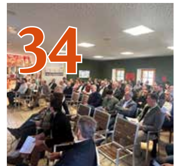
DELEGIERTENVERSAMMLUNG der Schweinehaltung Österreich in der Steiermark