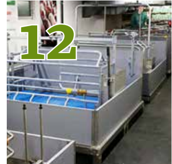
ABFERKEL-BEWEGUNGS- BUCHTEN Ausstellung in Wels eröffnet