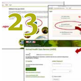
TGÖ: Tiergesundheitsdatenbank AHDS