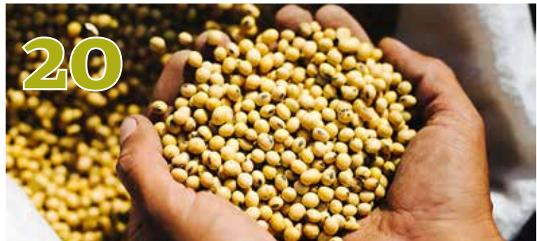
DONAU SOJA Für ein resilienteres Ernährungssystem und einen geringeren CO 2 -Fußabdruck